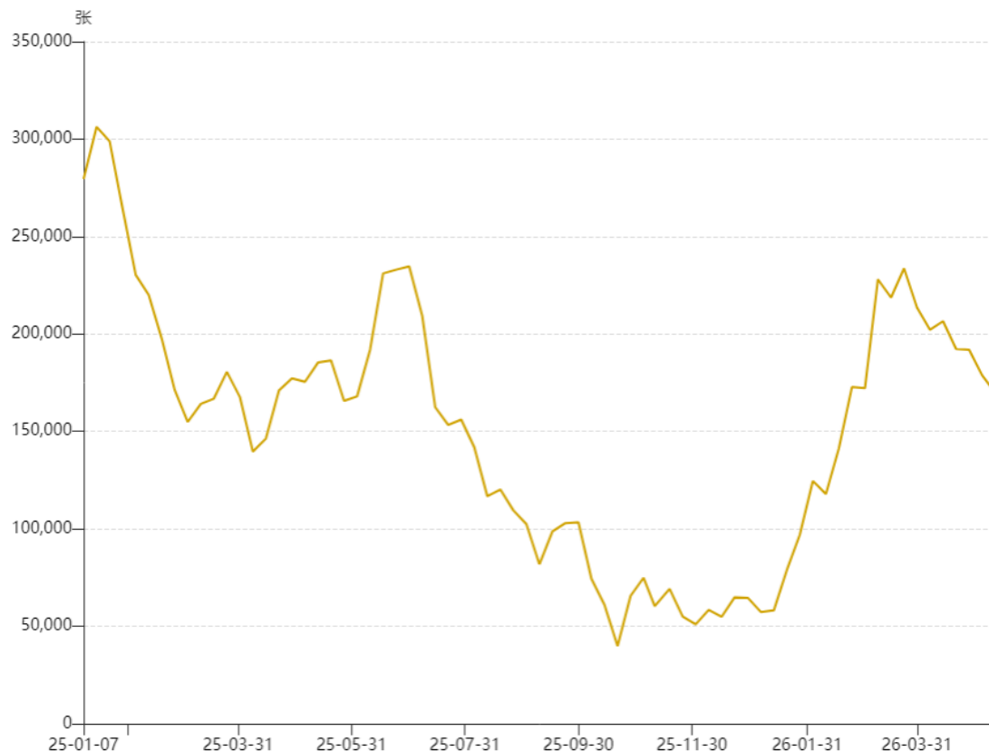
图二：NYMEX基金净多

基金动向方面，NYMEX和ICE原油的基金净多在3月中旬前后出现了持续减少，以NYMEX原油为例，基金净多在3月24日当周达到阶段高点233620手后持续减少，最新5月12日当周数据为169877手，减少了27%，数据显示出基金对于中东局势的后续发展保持相对理性的判断，并未在局势高潮时明显增持净多。